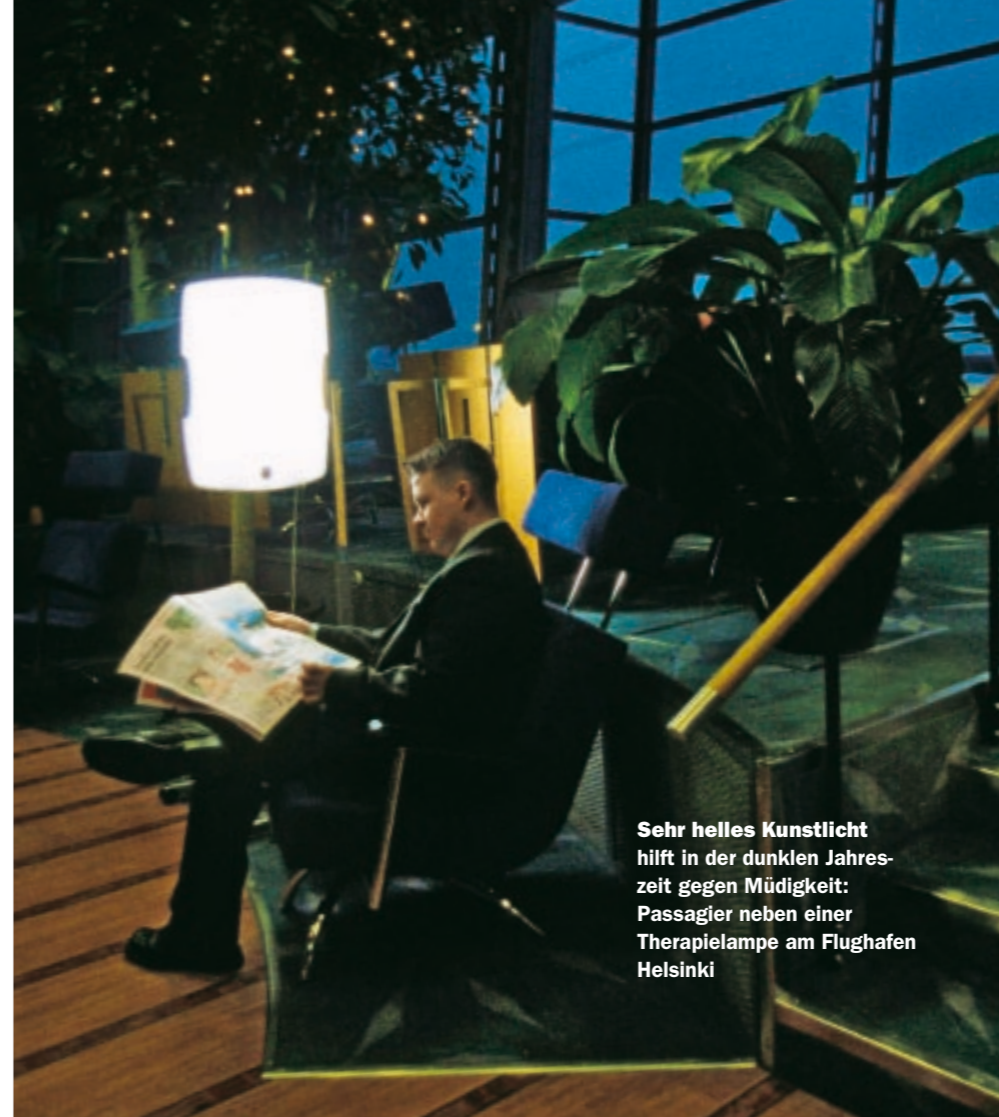
Sehr helles Kunstlicht hilft in der dunklen Jahreszeit gegen Müdigkeit: Passagier neben einer Therapielampe am Flughafen Helsinki